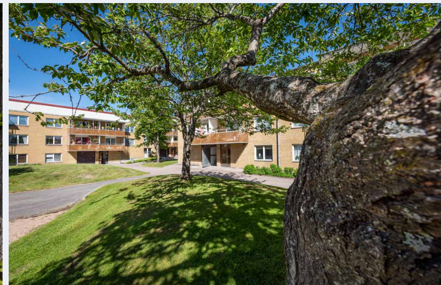
Alebyggen har ett varierat fastighetsbestånd och med olika ålder. Fastighetsavdelningen ansvarar för långsiktigt underhåll och ombyggnationer av hus och marktytor så att de kan leva vidare i ett bra skick.