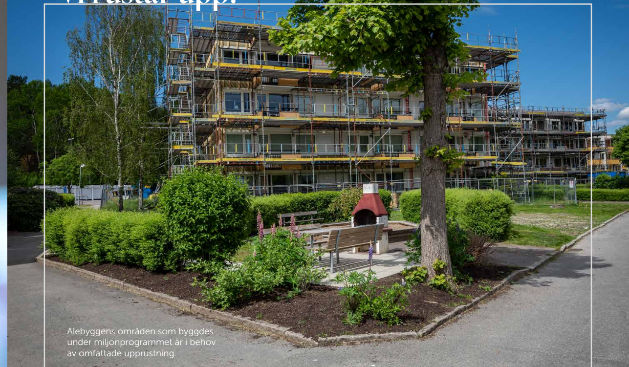
Alebyggens områden som byggdes under miljonprogrammet är i behov av omfattande upprustning.