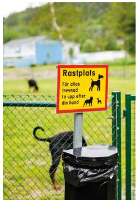
Hundrastgården i Nol byggdes efter att hundägare legat på kommunen.

– Det funkar hur bra som helst och känns verkligen skönt att jag