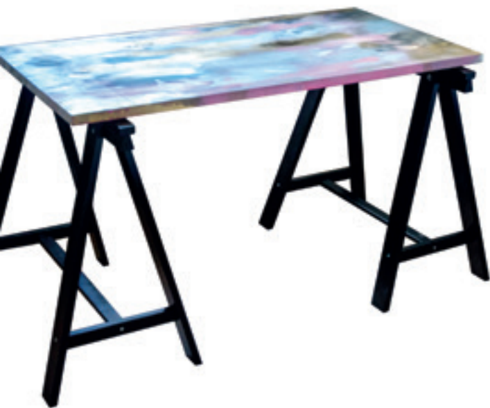
Pallen målades i vitt, silver och två rosa nyanser. Bordsskivan fick ett mer varierat mönster med inslag av svart och guld.