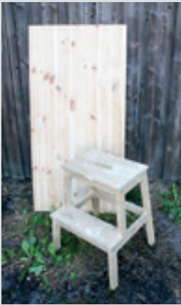
En obehandlad bordsskiva och en gammal pall fick ny färg.

Med hjälp av grafitti kan du få en cool vibb i rummet och ge nytt liv åt gamla möbler. En färg eller flera, metallic, svart, grått eller färgglatt – det är bara fantasin som sätter gränserna!