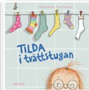
Tilda i tvättstugan av Linda Pelenius