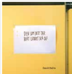
Den som inte tar bort luddet ska dö! av David Batra