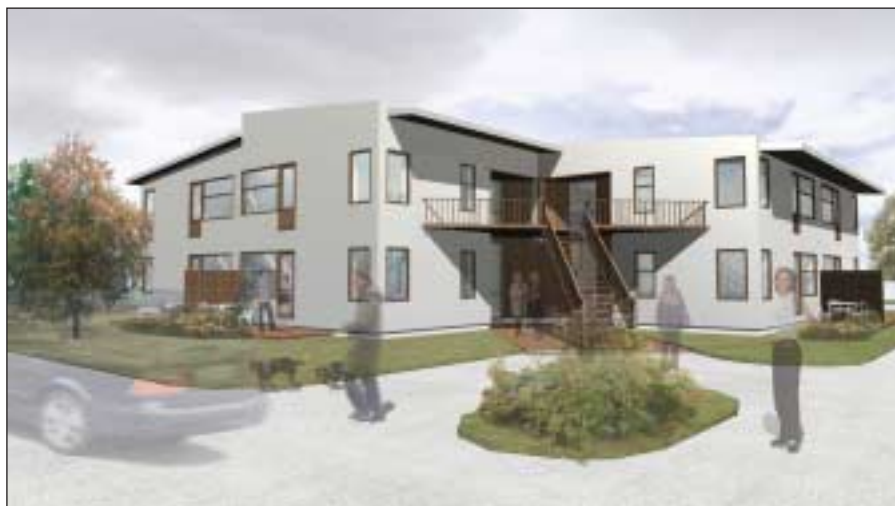
Intill vårdcentralen i Nödinge ska Alebyggen bygga två hus med sammanlagt 24 lägenheter. Illustration: Liljewall arkitekter AB.

Husen byggs i två plan och i det ena husets första våning blir det sex lägenheter och en gemensamhetslokal för LSS-boende. Det rör sig om två-