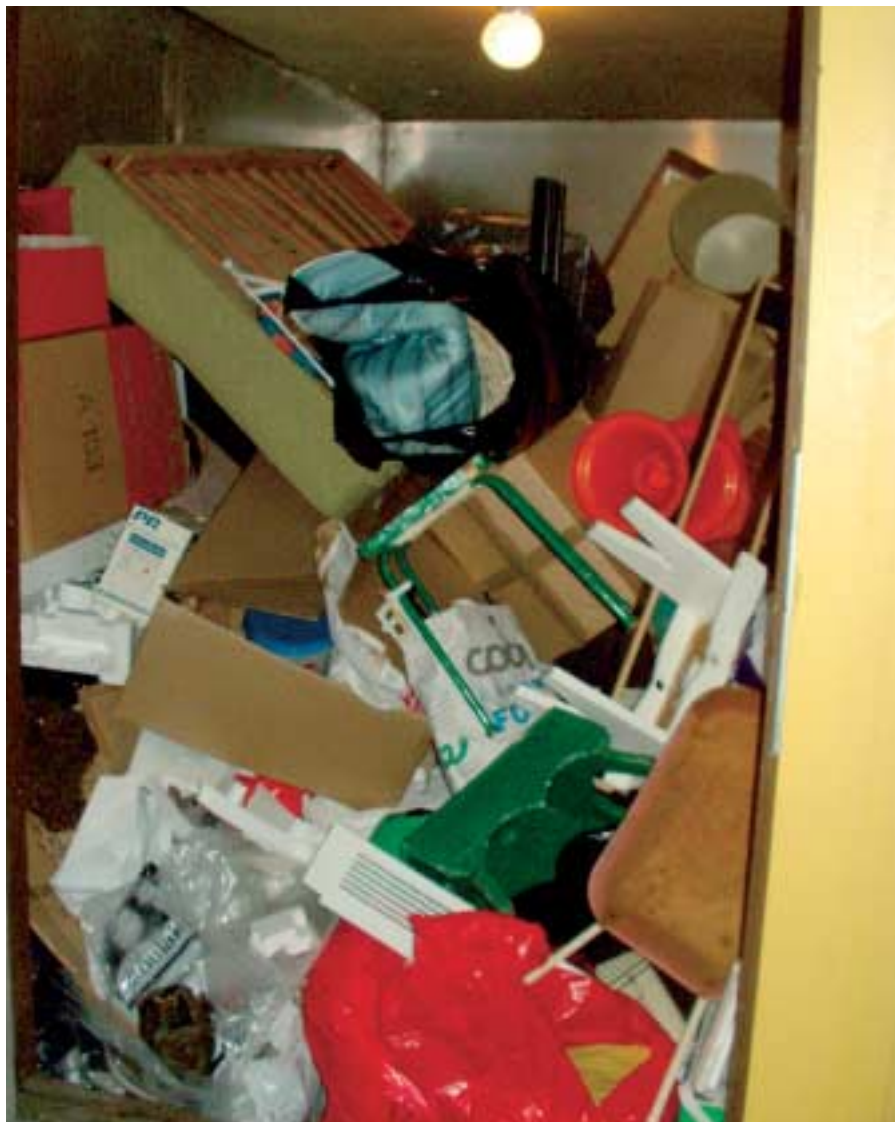
Skräckexempel på grovsoprum. Här finns i princip allt, mest sådant som ska läggas på andra ställen. Det är bland annat sådant här som genererar ökade kostnader för Alebyggen.

soprum är ett annat problem. Till exempel att någon roar sig med att slänga ut komposteringspåsar över golvet eller kastar de egna soporna på golvet istället för i behållarna.