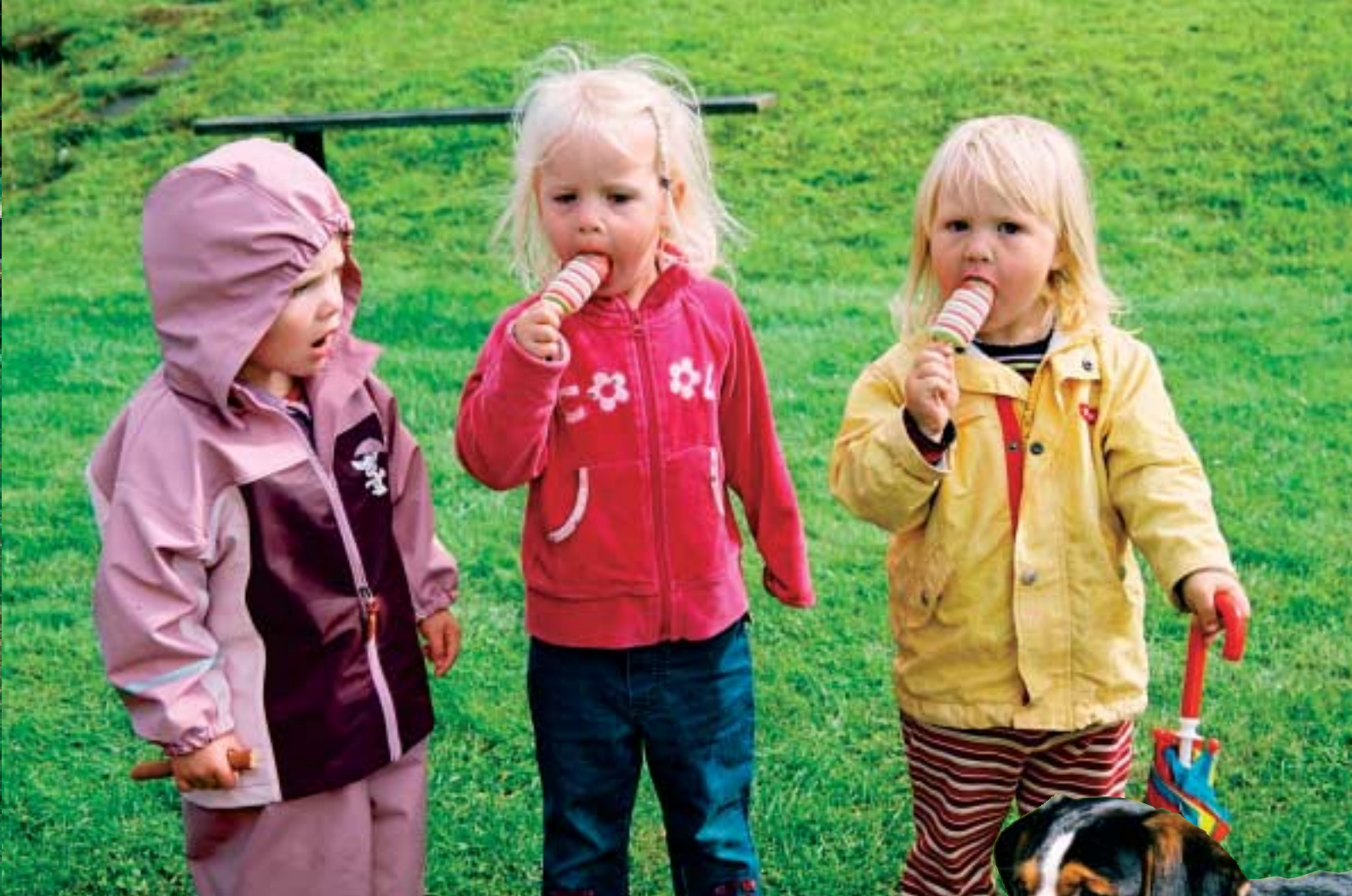
Ovan: En korv- och glasspaus är av yttersta nödvändighet när det är golfövning på Sjövallan. Höger: Intresserad åskådare, kanske med siktet inställt på bollar.