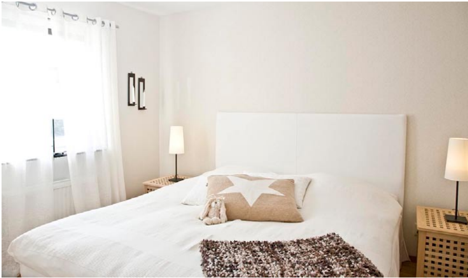
Sovrummet är ljust och går i vitt, beige och lite bruna detaljer.