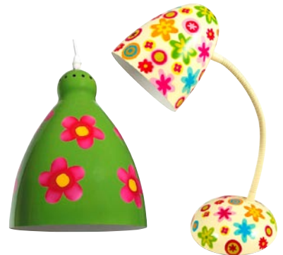
Förläng sommaren med blommiga lampor från www.bluebox.se