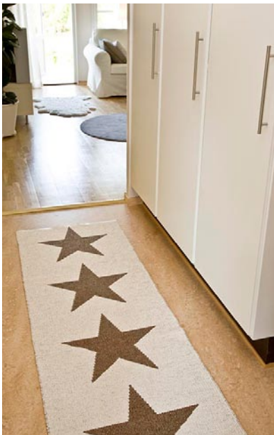
På golvet en Pappelinamatta. Nya handtag på garderoberna är en liten detalj som kan göra mycket i ett rum.