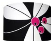
Bordslampan Moredon med vit keramikfot kan beställas från www.favoritsaker.se