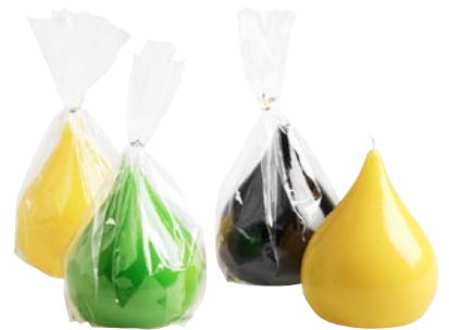
Ljus i form av droppe. Finns på Åhléns.

Hemlängtan tipsar om detaljer som lyser upp i höstmörkret.