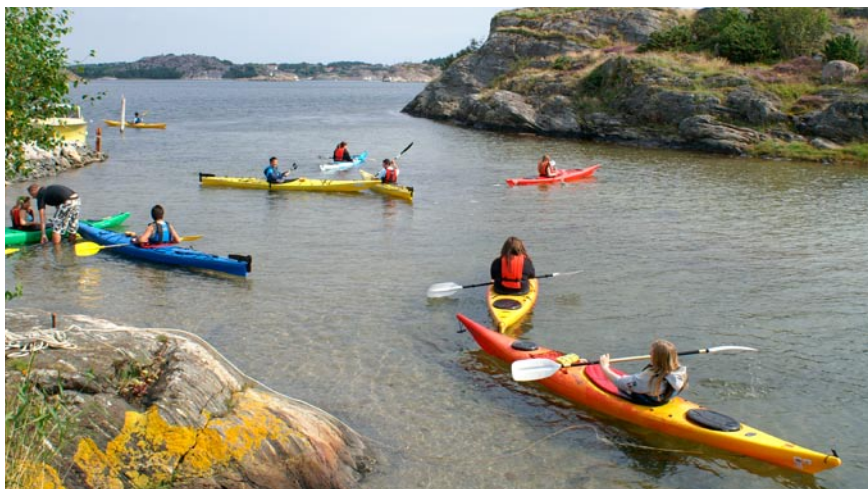
Här ser det ut som om deltagarna är på väg lite varstans, men med en mästertlig kajakkapten i form av Julle blev det ordning på torpet.

Meningen med sommarlägret var att erbjuda boende i Alebyggens bostäder en möjlighet till andningspaus innan höstterminen körde igång.