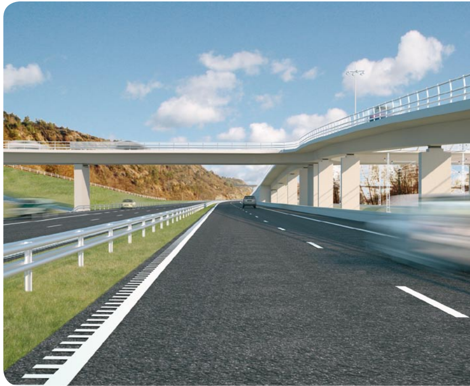
Nu ska det bli planskilda korsningar i Ales samhällen och ungefär som på bilden kommer de nya

–Vår bedömning är att framkomligheten under den närmaste tiden, på etappen Nödinge–Nol, kommer att vara ungefär som i dag, säger hon.