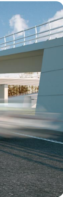
trafikmoten att se ut.

Arbetena med den nya lokalvägen påbörjas till hösten och då startar sprängningsarbeten norr om Bohus.