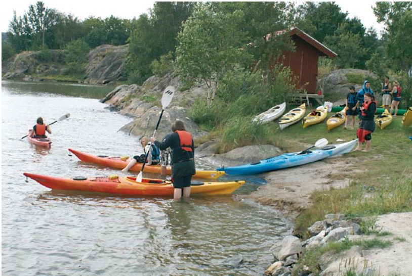
Förra årets läger var lyckat och uppskattat, med bland annat kajakpaddling på schemat.