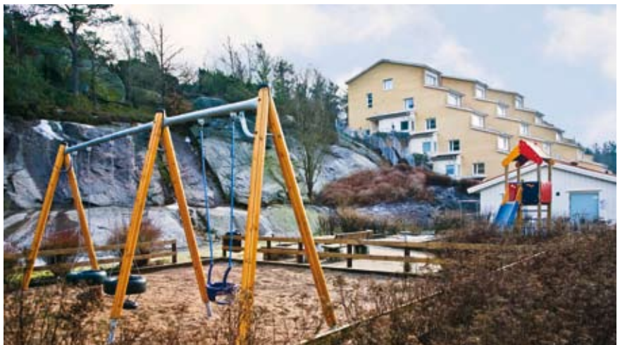
Den nya föreningen hoppas få en egen boulebana i området och undersöker om den kan anläggas intill lekplatsen.