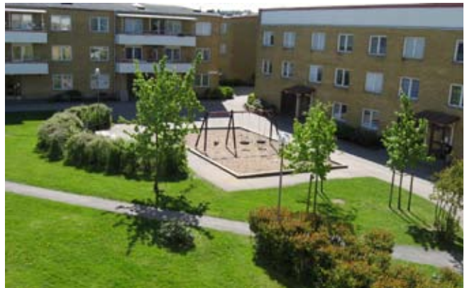
Gårdarna är uppmätta för att man ska kunna räkna tiden för skötseln.

Alla dessa mätvärden har sedan använts för att ta reda på hur lång tid det tar för fastighetsskötarna att ta hand om området. Att ha dessa fastslagna värden gör också självförvaltningen lättare att hantera. Genom dem kan hyresgästförening på ett enkelt sätt få en överblick över vad