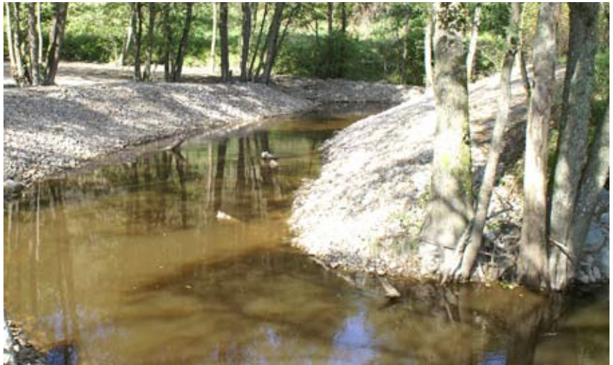
Den nya åfåran i Alafors har fyllts upp med grus och större stenar för att behaga lax och öring under deras lekperiod.