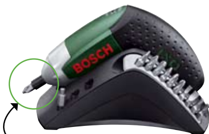
Den löstagbara delen är en bits