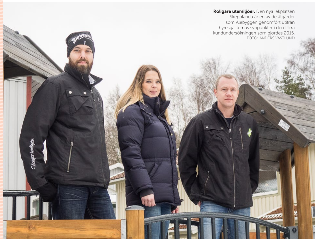
Roligare utemiljöer. Den nya lekplatsen i Skeplanda är en av de åtgärder som Alebyggen genomfört utifrån hyresgästernas synpunkter i den förra kundundersökningen som gjordes 2015.