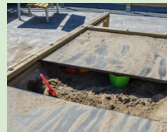
Plats för unga hyresgäster. Nya gungor, en ny klätterställning och en mjuk beläggning på marken är några av nyheterna på den nyligen upprustade lekplatsen i Skeplanda. Dessutom har sandlådan här, liksom på flera andra lekplatser, utrustats med lock för att hålla katter borta.