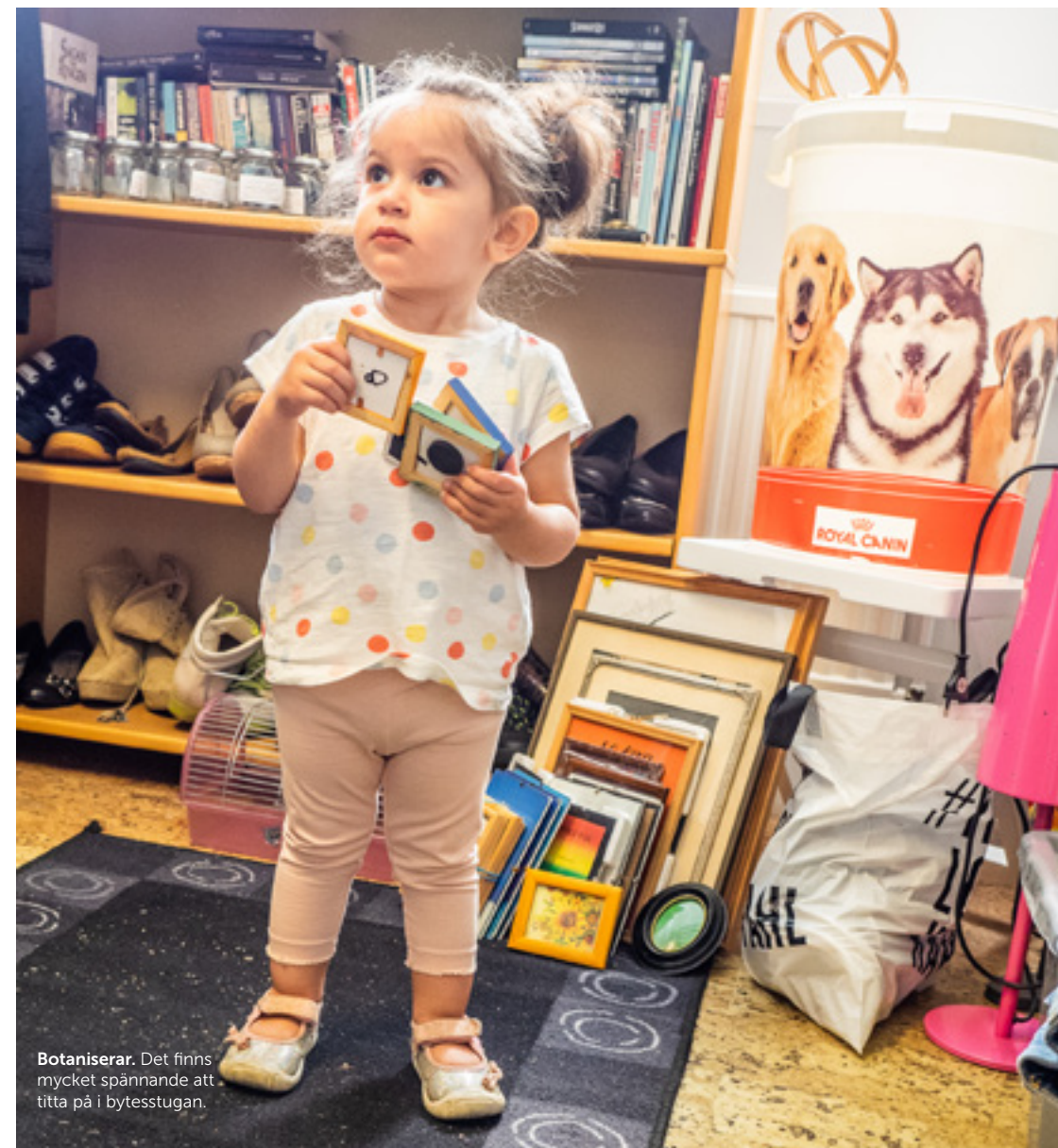
Botaniserar. Det finns mycket spännande att titta på i bytestugan.