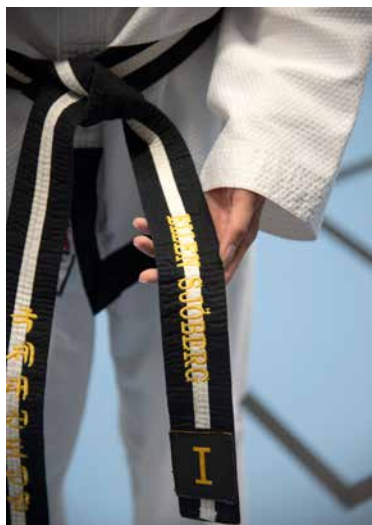
Ellen har svart bälte och Dan 1, att nå högsta Dan, 9, kräver många, många års träning.