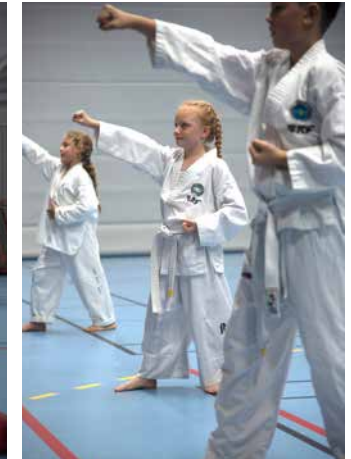
Disciplin är en viktig del i Taekwon-Do och träningen lär barnen att kontrollera sin kropp.

allsidig och främjar förutom styrka och smidighet, koncentration, självkontroll, mod och självförtroende.