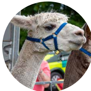
De charmiga alpackorna var poppis på bondgården, liksom ponnyridning, djurambulansen och djurakuten – där nallar och mjukdjur kunde bli ompåstrade.