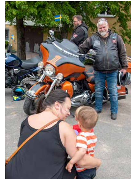
Motorcyklarna som Crusaders for justice visade upp lockade både stora och små. Föreningen passade på att informera om sin familjedag för Ukrainska flyktingfamiljer den 2 juli. Info och anmälan finns på föreningens webbplats.