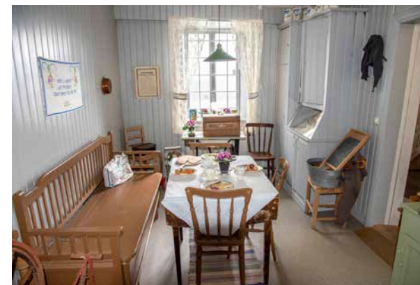
Salt sill och potatis till middag. På museet finns också möjlighet att se hur det kunde se ut i en arbetarbostad i Surte.

– Det var en chock för oss alla när vi fick veta att PLM skulle lägga ner glasbruket. Och det väckte förstås star-