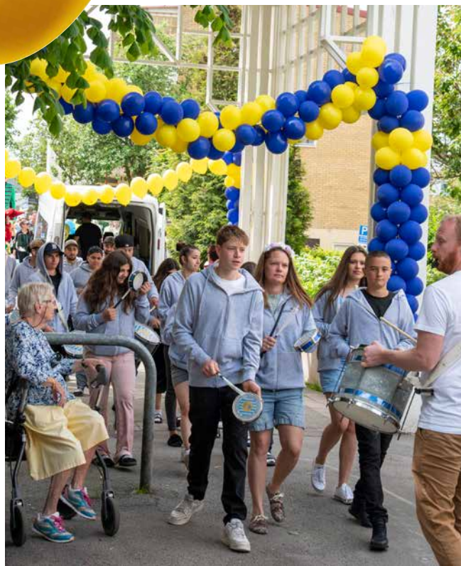
Det trummande sambatåget bjöd på festivalstämning när det inledde nationaldagsfirandet med att tåga genom området.

Elva gårdar och lika många teman med allt från Vikingatid till moderna fordon och däremellan massor av lek, mat och tävlingar.