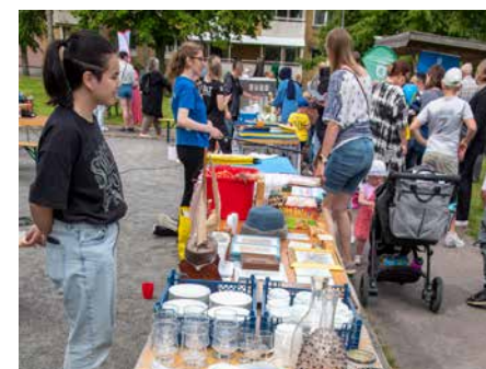
På Ale kulturgård hade HBTQ-föreningen i Älvängen loppis och fiskdamm för att samla in pengar så att föreningen kan åka till Pridefestivalen i Stockholm.