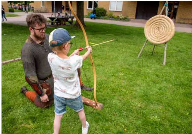
Lära sig skjuta pilbåge var en av aktiviteterna på vikingagården. Inte helt lätt visade det sig, men till slut gick det.