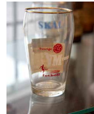
Jubileumsglasen inför fotbolls-VM i Sverige 1958 dekorerades på Surte glasbruk.