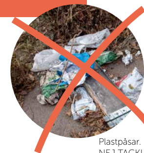
Plastpåsar. NEJ TACK!