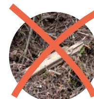
Impregnerat trä. NEJ TACK!

Jord Invasiva växter (frön, växt, och rotdelar) Ris (Större än 3 cm i diameter på kvistar) Pallar Kartong Icke-organiskt material (Plast, gips, metall, stenar, tegelstenar, glas, textil m.m.)