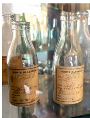
I museet kan man se många av de förpackningar som tillverkades i Surte, bland annat den här mjölkflaskan.